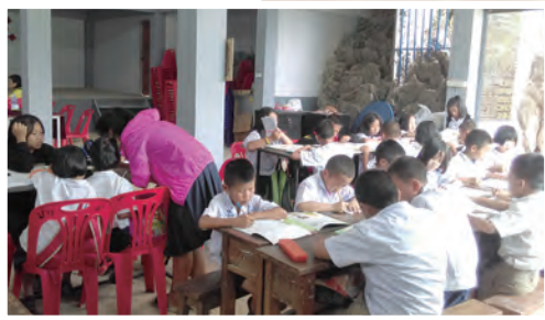
▲芒岡村文明中學有很多學生騎機車上學 ▲振華小學低年級學生的課業，由國二的學生（穿紅衣者）來指導。

大同中學的校舍建築上很像台灣一般的水泥建築，很雄偉！這是1所很重視書法教學的學校，辦公室外的公布欄上，掛有每年舉辦大型書法比賽的得獎作品。各班門口貼著門聯，高三教室後