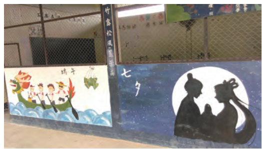
▲崇聖學校牆面繪畫，顯示雖在泰北卻不忘中華文化。