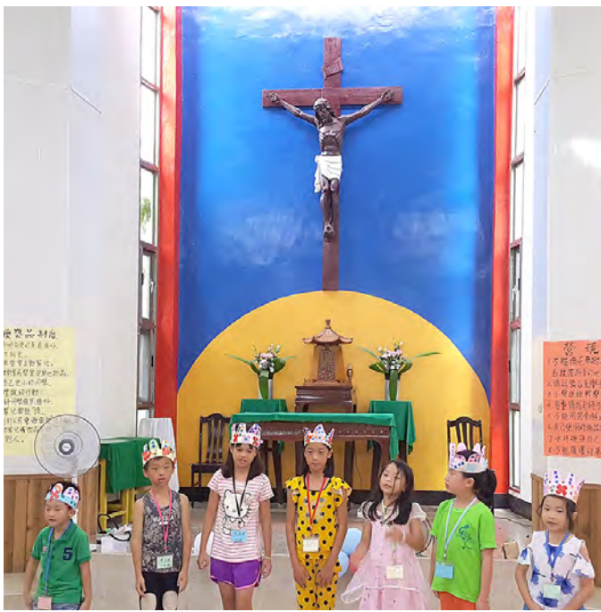
▲聖歌比賽團體組，每一組都挖空心思地拿出絕活兒賣力演出。 ▶位於馬祖南竿的馬港天主堂外觀醒目，在綠叢中宛如世外桃源。