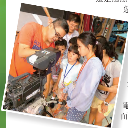
▲攝影師大哥哥教導大家如何透過攝影機抓鏡頭。 ▲歡迎孩子們來到這裡學習，光啟社的大門永遠為大家開著。