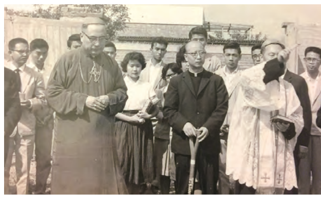
▲1961年，成大天主教大專活動中心的動土大典，左起：當時的于斌總主教、賈彥文神父、羅光主教一起行禮祈禱。

我們敬愛的賈公於8月22日晨安息主懷，請為他的靈魂祈禱，也感謝賈公豐富滋養了我們的生命。