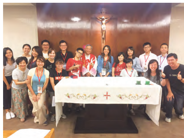
▲收錄禮結束後，洪山川總主教與慕道班的青年朋友合影。

我們的慕道班名字是「饗愛」，因為每一個人都帶著「想被愛、想去愛」的渴望來到這裡，而在這裡發現天主的愛是無條件的、超越一切的豐盛賜予。我們願意每一天都在這趟生命的朝聖之旅中飽饗祂的慈愛，讓