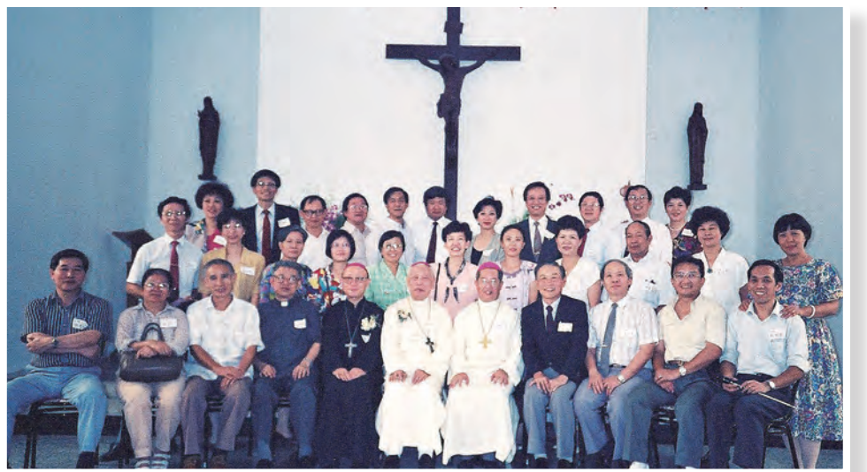
▲天主教大專中心成立30周年慶，回娘家的遊子們與賈公合影。

10多年前退休後，因為基督服務團的關係有機會參與「賈神父育才計畫」，從事獎助學金的管理與發放工作，探訪受助學生，也與學生有信件來往，在這愛的行動上，貢獻自己小小的力量，並持續至今。成大的校友們和服務團的姊妹們，回想起賈神父在他們年輕時，想方設法為他們尋求獎學金，去歐洲探視他們的生活，不僅給經濟上的支持還關懷他們的生活和學習。他們知恩報愛，捐款慷慨，每年仍舊持續探望賈公，我被他們的用心與慷慨所感動。育才計畫至今已14年，這自發性「知恩報愛」的計