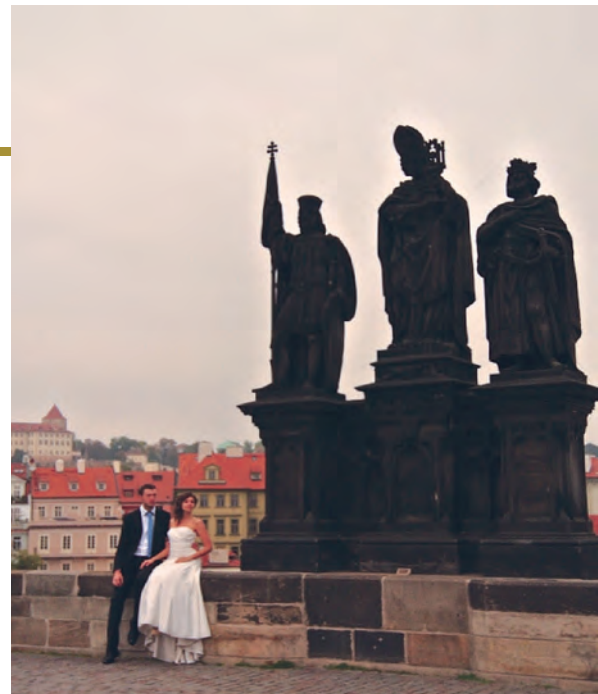
▲人應該離開自己的父母，依附自己的妻子，二人成為一體。

後來演變得不可收拾，如「法國大革命」，甚至「德國納粹的崛起」。有些人是基於善意支持「同運」，但是這個「善意」卻轉變成「認同」，然後由「認同」變成認同「性解放」：為了達到「尊重選擇」的目的，就要剝除所有倫理、道德、宗教……上有關性的各種「價值判斷」，因此「所有性的選擇都沒有對錯」「性權即人權」，只要注意「安全性行為——戴保險套」和「尊重身體自主權」（這在彩虹官網就可以看到）。非常冠冕堂皇的說詞，在同志每年的彩虹遊行，就會看到各種將「離經叛道」行為發揮到極致的「創意」。我從約10年前就抱著支持同性戀者的心態參加彩虹遊行，也一直困惑於其中的複雜性。