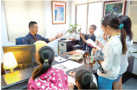
▲孩子們在光啟社進行採訪練習，了解社內不同職位的工作。