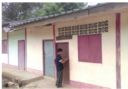
▲民族小學校長來開門，迎接我們參訪。