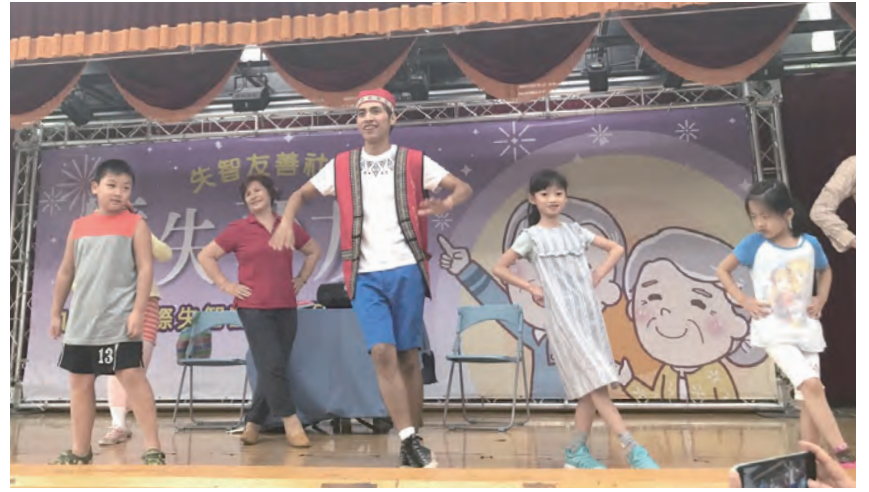
▲劇團邀請大朋友、小朋友一起跳〈大腦保健體操〉。