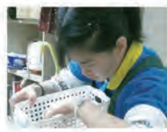
古亭店 捷運古亭站內 近9號出口