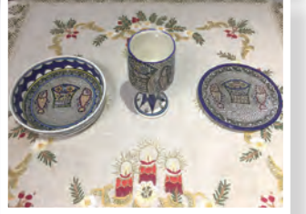
▲賈公在朝聖旅程挑選的五餅二魚爵盤，至今仍珍藏在陳麗如家中。

歡迎支持賈總主教培育青年的育才計畫 銀行：上海商業儲蓄銀行新店分行 戶名：財團法人樂銘文教基金會 帳號：292 03000 180015 請註明「賈神父育才計畫」