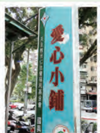
國興店 近青年公園