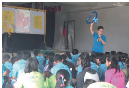
▲回龍中學開放禮堂上課，老師十分賣力。