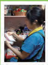
大直店 捷運大直站內 近3號出口