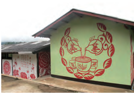
▲美華小學校徽與美麗校舍是台灣志工的創意