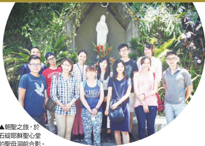
▲朝聖之旅，於石碇耶穌聖心堂的聖母洞前合影。