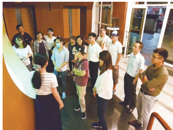
▲青年慕道者見自己的祈禱意向放在聖母媽媽態像前被照看著，心中又驚又喜。