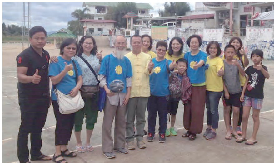
▲從台灣來的領隊組與邊龍組志工老師及孩子們，在光華中學歡喜合影。

上主，我伸出手，請你帶領，讓我走你願意我走的路，我深信你的一切安排都是最好的。 (全系列完)