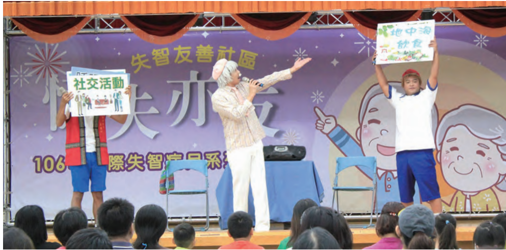
▲《我愛阿嬤妮》劇中帶入失智症的預防資訊