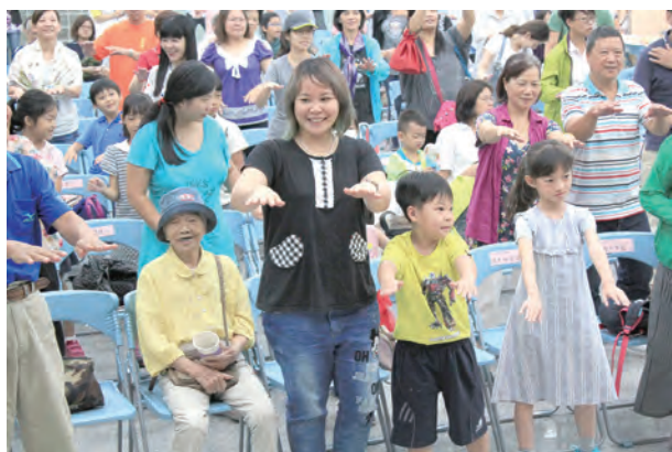
▲民眾開心參與劇團的帶動跳 ▶演員與民眾喜樂大合照 ▼現場民眾踴躍參與有獎徵答

天主教單國璽弱勢族群社福基金會為單樞機「活出愛」的精神，陸續進行全台8縣市的公益演出，包括：金門（9月9日）、花蓮（9月16日）、台中（9月24日）、桃園（10月7日）、台北（10月22日）、澎湖（11月11日）、台東（11月22日）、連江（11月25日），皆免費入場，每個場次有失智症專業領域專家蒞臨映後座談，參與活動就有機會獲得《伊布奶奶的神奇豆子》繪本，或《不失智的台式地中海餐桌》養生書，諮詢專線：02-2304-5899 林小姐。