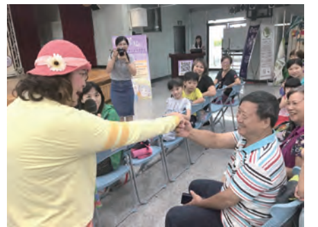
▲民眾熱心要帶找不到路的阿嬤妮回家

字，包括情緒起伏變很大、就連最熟悉的菜市場也會迷路，家中物品老是隨意擺放，造成環境危機重重。劇中更是融入了新的年輕原民角色，帶出了原鄉議題及生命傳承之重要性。同時結合失智老人基金會發行的《伊布奶奶的神奇豆子》繪本，用愛鼓勵祖孫間代間共融。