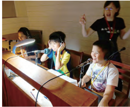
▲戴起耳機、面對麥克風，每個人都進入專業錄音室成為小小配音員。