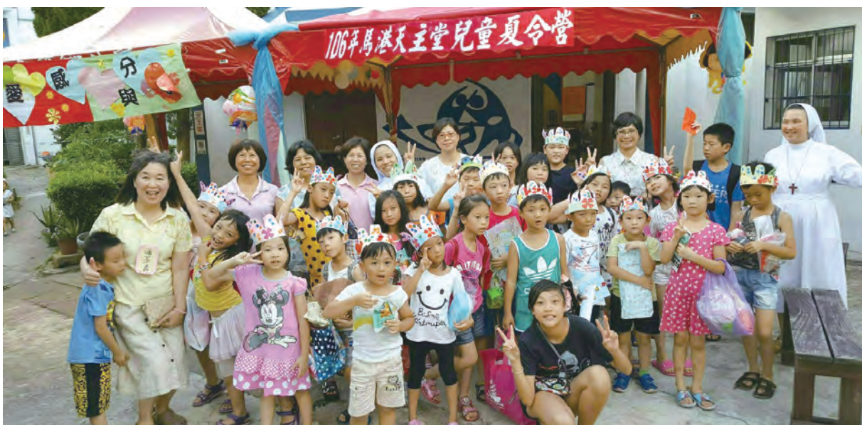
▲2017年馬港天主堂兒童夏令營共融歡樂大成功

3.愛的延燒：夏令營閉幕前，有打水球競賽，小朋友玩得不亦樂乎，要求修女8月27日主日彌撒後，再來第2回合，修女從善如流，也和她們一起打水戰，修女的衣服全被淋濕，得了重感冒（截稿前尚未痊癒），如此做的原因無他，只為了讓這群小朋友，在夏令營結束後，依舊願意來到馬祖天主堂，與主相遇。