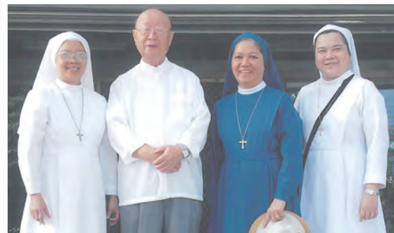
▲修女們照顧賈公無微不至，也從他身上得到寶貴靈修成長。

1978年，賈公到歐洲，路經比利時，我們乘機請主教主持婚禮，藉著您的祝福，開杰和我共渡了和睦的50年，感謝您——主教。在我數十年的生命中，能活在天國裡，是主教您給我付的洗，付的堅挺，主教，感謝您。此恩此德，無以為報，唯努力守誠命，愛天主，愛