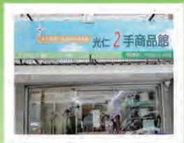
忠孝店 近捷運忠孝復興站

龍山啟能中心·育仁啟能中心 育仁兒童發展中心·聖心兒童發展中心 大同中山早療資源中心·萬大社區家園